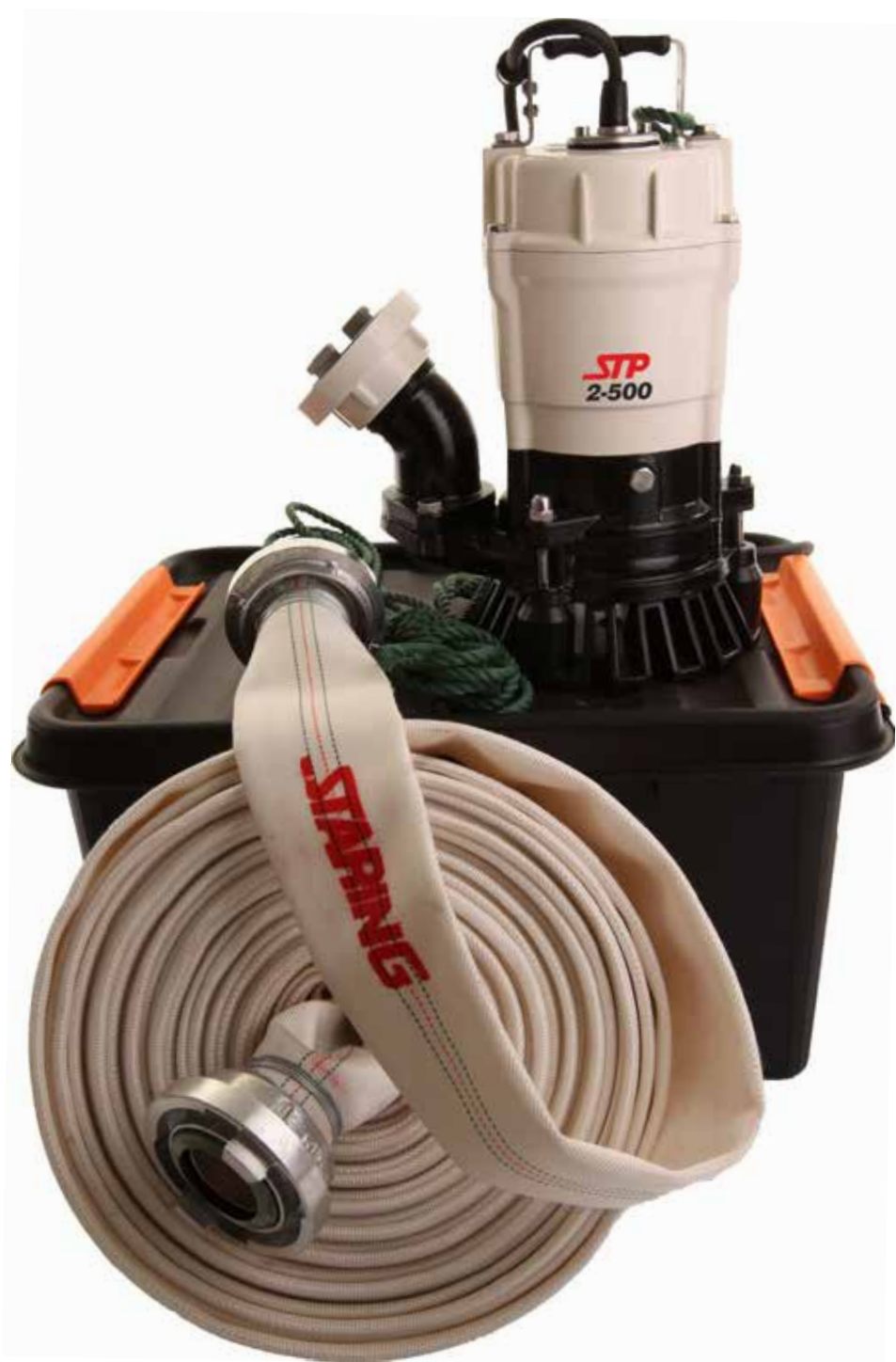
» Pumpsæt i boks «