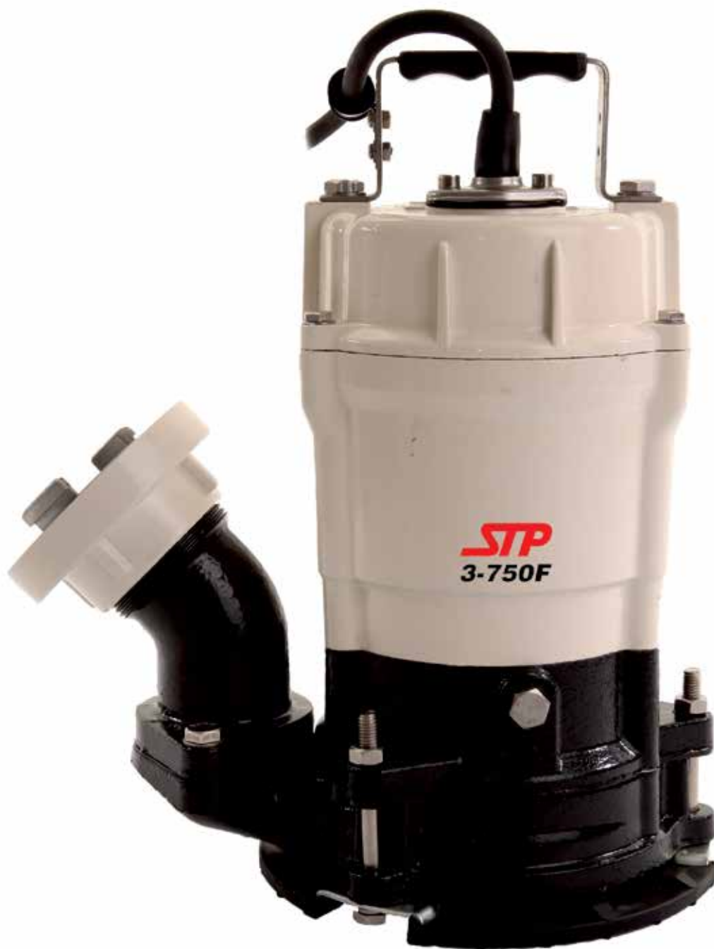
» 3" fladsugspumpe «