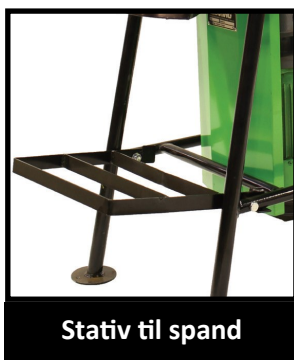
Stativ til spand